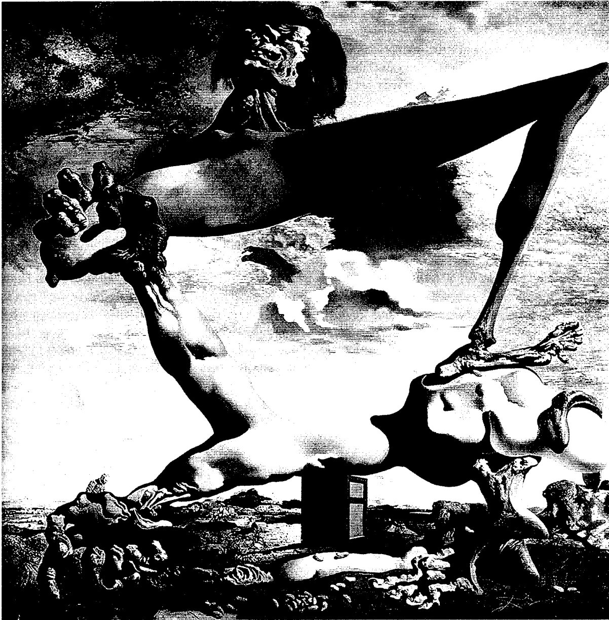
Construcción blanda con judías hervidas (Premonición de la Guerra Civil) . Salvador Dalí 1936

organische structuren waar het LzO vanaf wil. De-leuze stelt dat zowel Bacon als Kafka om deze reden de ruggengraat als zwaard onder de huid beschouwen, de executeur van het leven, de geïnternaliseerde externe oorzaak die altijd al ons doorzettingsvermogen beperkt (om met Spinoza te spreken). De botten organiseren het verlangen, reageren erop door het te structureren van binnen uit.